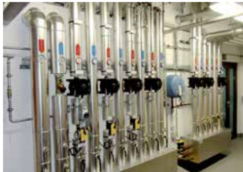
Kläranlage Andelfingen, erstellt durch Firma Braun & Klöti AG 2013

Die Haupttätigkeit ist das Erstellen von Wärmeerzeugungsanlagen wie: alle Wärmepumpen (Wärme aus der Luft und aus dem Boden), Holzfeuerungen,